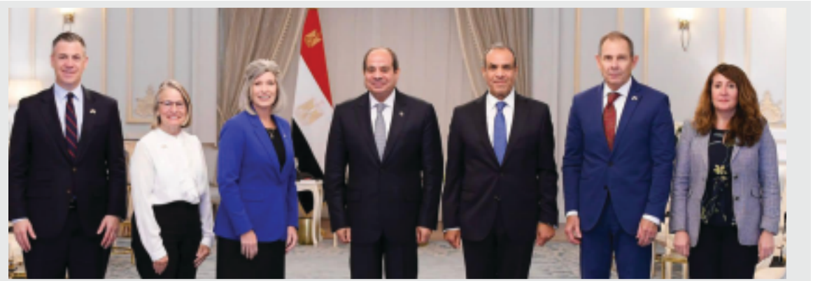
في أخطر مراحل التفاوض والوساطة، دبلوماسيا وسياسيا وأمنيا

الساحل الشمالي .. صياغة دور «المصانع المتعثرة» في القطاعات الإنتاجية تحركات مكثفة لإعادة صياغة دور «المصانع المتعثرة» في القطاعات الإنتاجية